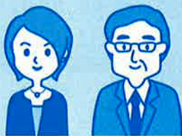
事業を行い、労働者を雇っている人