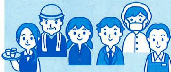
賃金を支払われているすべての人